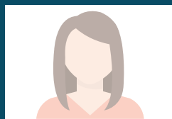
Ninfa Wyss nach 21 Jahren