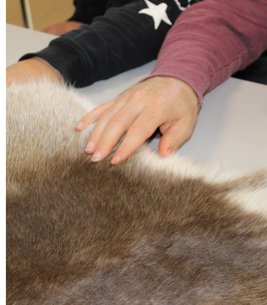
Am Grönlandtag gab's Eis und ein Rentierfell zu betasten.