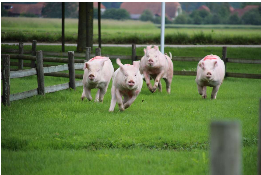
Hochmotivierte Schweinchen sorgen für den Höhepunkt: das Söilirennen

Im Namen aller Bewohner:innen danken wir Ihnen von Herzen für Ihre Unterstützung! Förderverein Brüttelenbad, Mühlegasse 34, 3237 Brüttelen IBAN: CH15 0079 0016 5910 9763 7