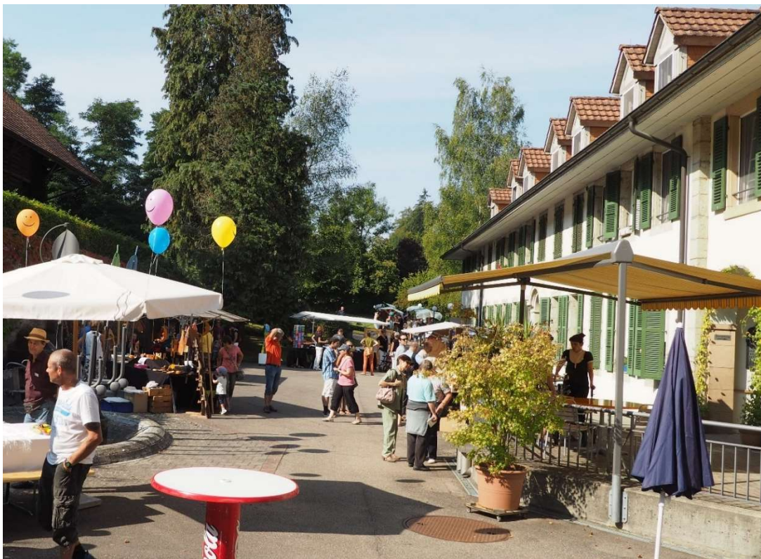
Chilbi - Stimmung