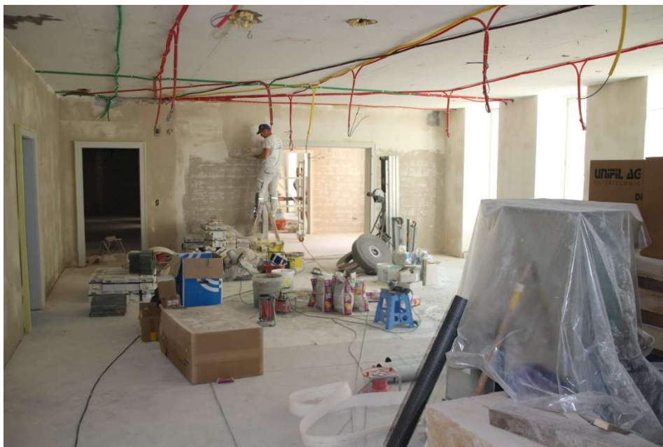
Essraum mit Blick Richtung Cafeteria

Das Neu- und Umbauprojekt «mis Huus – dis Huus» geht nach rund vier Jahren seinem Abschluss entgegen. Nach dem Neubau und der anschliessenden Sanierung des Osttrakts wird zurzeit der West-Takt des historischen Hauptgebäudes umgebaut und renoviert. Die Arbeiten sind weit fortgeschritten, die neue Raumaufteilung im Erdgeschoss mit der Cafeteria und dem Speisesaal ist angelegt und die Räume strahlen bereits im Rohbau neue Gediegenheit aus. Die Konturen der umgebauten Küche mit den neuen Arbeitsplätzen versprechen einen funktionalen Ablauf. Die Fertigstellung läuft nach Plan, aber es stellen sich immer wieder knifflige Herausforderungen: namentlich das Thema Feuchtigkeit beschäftigt die Planer. Schliesslich ist das Brüttelenbad ein historisches Bad in Tallage und inmitten eines Quellgebiets. Bei der Sanierung des Kellergeschosses gilt es, den geeigneten Massnahmen-Mix von Dämmung und Ventilation zu finden. Bei der Installation der Gebäudetechnik musste Rücksicht genommen werden auf die Fledermausfamilie, welche das Brüttelenbad ebenfalls seit vielen Jahren bewohnt.