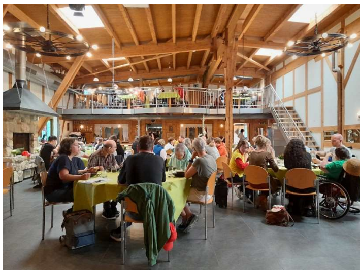
Ein gluschtiges Mittagessen in rustikalem Ambiente