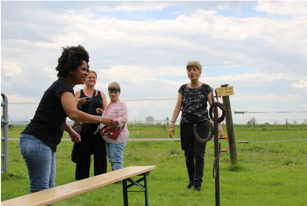
Spass und Konzentration beim Hufeisenwerfen