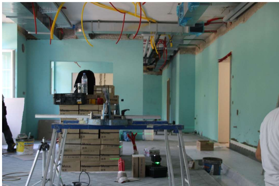
Die künftige Produktionsküche mit Durchblick