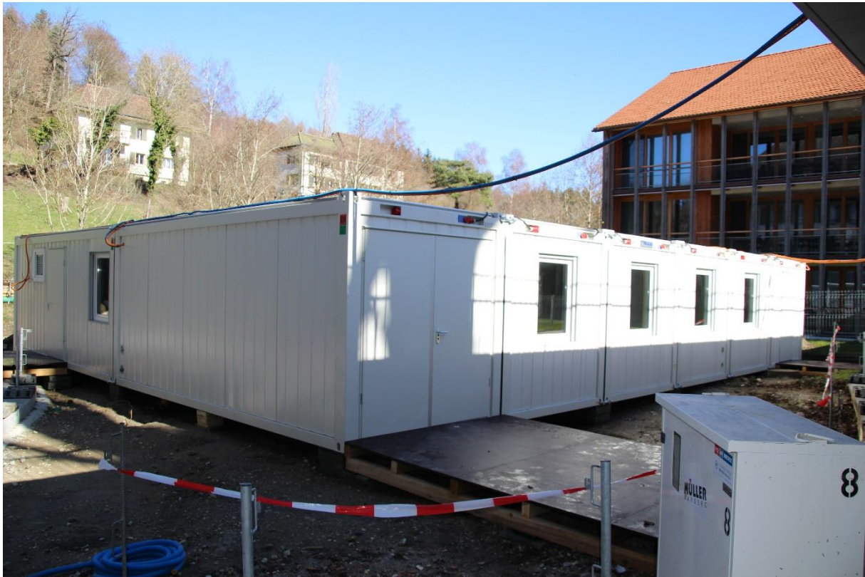
Baucontainer mit Küchen- und Lingerie-Provisorium. Übrigens, die Containeranlage mitsamt der Kücheneinrichtung steht im Frühling 2025 zum Verkauf.