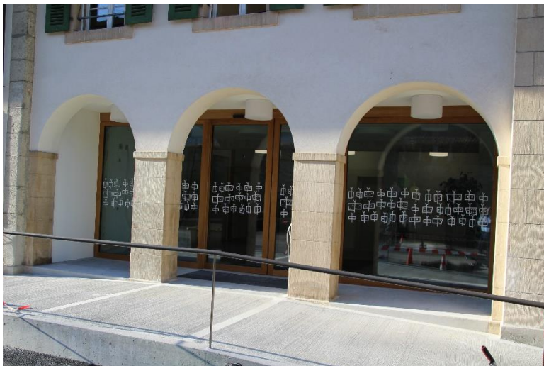
Der neue Haupteingang