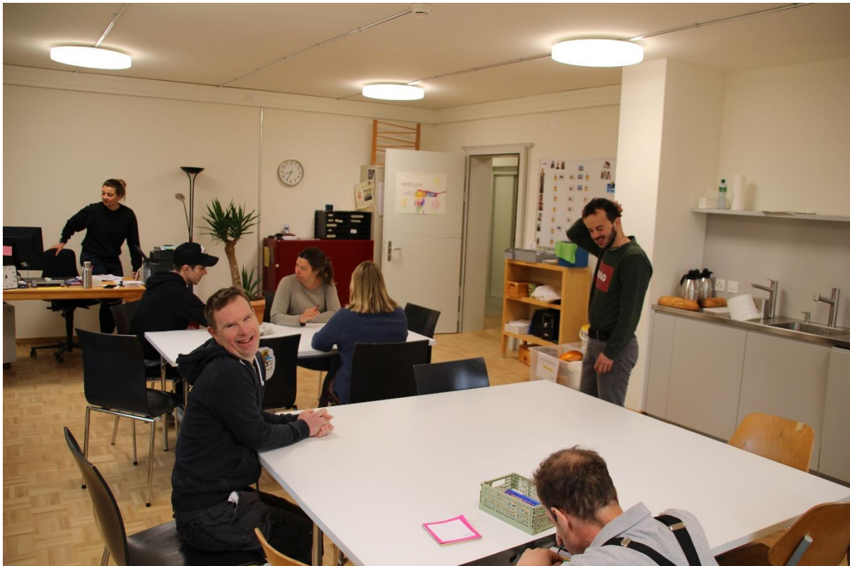
Die Bewohner:innen im neuen Atelier

Das Neu- und Umbauprojekt «mis Huus - dis Huus» wird im letzten Jahr zu einem Renovationsprojekt. Nachdem 2023 der Ost-Trakt des historischen Hauptgebäudes umgebaut und erneuert wurde, ist nun der West-Trakt an der Reihe. Er ist leergeräumt und von den Handwerkern in Beschlag genommen worden. In den kommenden Monaten wird die Küche saniert; sie soll künftig noch mehr Arbeitsplätze für Menschen mit Beeinträchtigungen bieten und behindertengerecht neuausgestattet werden. Die Cafeteria wird ebenfalls entsprechend erneuert. Die Essräume werden stilgerecht renoviert und erhalten etwas von der gediegenen Atmosphäre des einstigen «Hôtel des Bains de Breitiège» zurück. Während der Arbeiten werden die Essräume und die Wäscheverarbeitung in den neuen Mehrzweckraum verlegt; für die Küche sowie die Waschmaschinen und Trockner wurden Container zwischen den Gebäuden im Freien platziert. Das alles war wiederum mit grossen Räumungs- und Zügelaktionen verbunden: ein Teil der Ateliers, der Pflegedienst und die Verwaltung konnten im März von den Provisorien in ihre definitiven Räumlichkeiten im sanierten Ost-Trakt übersiedeln. Die anderen Ateliers sind noch für ein weiteres Jahr in provisorischen Räumen untergebracht.