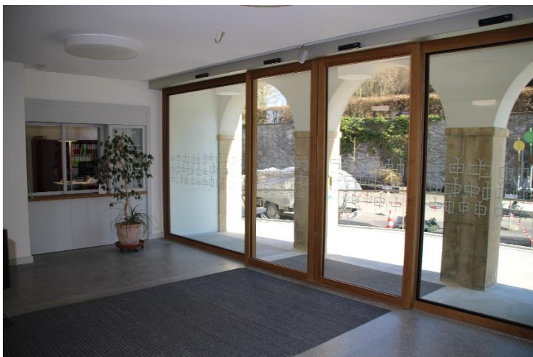
Die grosszügige Eingangshalle